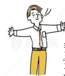
深呼吸 pika.jp - 81967906

呼吸回数過多が体内の酸素不足を招く。さらに呼吸に関する意外な盲点を指摘します。「ストレスや不規則な生活による自律神経の乱れ、姿勢の悪さなどから呼吸が浅く速くなっている人が目立ちます。これはプチ呼吸過多の状態です。どんな空気を取り入れれば問題がないように思えませんが、呼吸にも適正な量や質があるのです」そのカギを握っているのが二酸化炭素だといいます。血液中の酸素を細胞へと送り込むには二酸化炭素の力が必要とのこと。